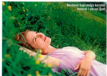
Bachove kapi mogu koristiti bolesni i zdravi ljudi

Bachovim cvjetnim kapima mogu se tretirati depresije, razni strahovi, gubitak obostranosti, zadržanost, iscrpljenost, besvoljnost, agresivnost, razdražljivost, kožni problemi (psorijaza, dermatitis, alergije, ekcemi, akne, herpes). Tu su i problemi s dišnim putovima (upalna sinusna, astma, bronhi-