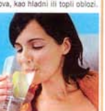
Osobito dobro reaguju žene koje imaju teškoća s bolnom i neredovitim menstruacijom, one u klimakteriju, s cistama i tumorom, seksualnim problemima...

Ove kapi sastavljene su od pet vrsta cvjetica, univerzalne su i mogu ih upotrebljavati svi, dok se ostale kapi pripremaju i rabe ovisno o problemima i psihičkom stanju osobe koja ih uzima. Kapi prve pomoći koriste se kod nesvjestice, stanja šoka, akutnih psihičkih i fizičkih bolnih stanja, oslobađaju od strahova, panike i vraćaju osjećaj sigurnosti. Pomažu i kod uboda insekata, nagnječenja ili lokalnih bolova, kao hladni ili topli oblog.