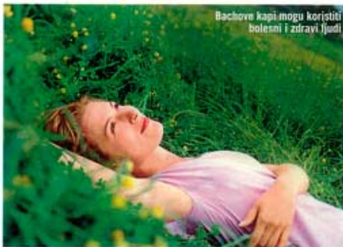
Bachove kapi mogu koristiti bolesni i zdravi ljudi

Dobri rezultati pokazali su se i kod tretiranja osoba koje su imale problema s alkoholom, drogom, PTSP-om , onih koje su doživjele neki šok, imaju samoubilačke misli, te koje su ovisne o cigaretama, hrani, kao i kod onih koje muči ekstremni umor, iscrpljenost, nesаница, noćne more. Pomažu i razdražljivim i plačljivim bebama, oada kad im niče pr-