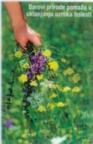
Darovi prirode pomažu u uklanjanju uzroka bolesti

Sve vrste šokova , bilo psihičkih, bilo fizičkih, gubitak drage osobe i teške nesreće, ogorčenje, ljutnja, svaljivanje krivnje na druge zbog vlastite loše sudbine mogu proizaći iz sumnje koju osoba osjeća prema sebi. Ti su preparati također pogodni za ljude s osjećajima nečistoće, za oslobodenje od lakših navika, neugodnih misli, pojave bradavica i ekcema, lišajeva i nezadovoljstva vlastitim izgledom. Preparatom cikorijske, vinove loze, bukve i izvornike vođe uspješno se mogu prirodnim cvjetnim esencijama iz sedme skupine tretirati sva ona